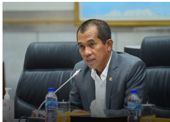
Dr. H. ABDUL KHARIS ALMASYHARI Wakil Ketua Komisi I DPR RI

Sebagaimana diketahui sebelumnya, Badan Siber dan Sandi Negara (BSSN) melaporkan bahwa terdapat 291 situs milik pemerintah disusupi konten judi online oleh para peretas sepanjang tahun ini. Adapun peretasan tersebut terdiri dari 23 persen perguruan