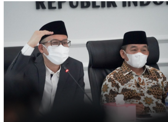
H. ECKY AWAL MUCHARAM Wakil Ketua Fraksi PKS DPR RI Ekonomi dan Keuangan

"Jumlah pengangguran tahun 2020 juga memecahkan rekor dengan jumlah Tingkat Pengangguran Terbuka (TPT) meningkat 2,67 juta orang, sehingga total TPT menjadi sebanyak 9,77 juta jiwa atau 7,07% dari angka angkatan kerja. Pada 2020 pengangguran usia muda Indonesia menjadi yang tertinggi di Asia Tenggara. Pengangguran usia muda di Indonesia meroket di angka 20,5%, padahal rata-rata pengangguran angkatan kerja muda di Dunia sebesar 13,7%,"