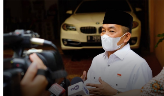
Dr. H. JAZULI JUWAINI, MA Ketua Fraksi PKS DPR RI

"Kalau kita tidak memiliki komitmen yang kuat tentang kebangsaan kita, bisa jadi nilai kebangsaan akan terkikis dengan nilai globalisasi yang merupakan efek perkembangan teknologi. Disinilah pentingnya semua komponen bangsa, harus berusaha bahu membahu untuk mengokohkan nilai kebangsaan," pungkias Jazuli. Anggota DPR RI dapil Ban-