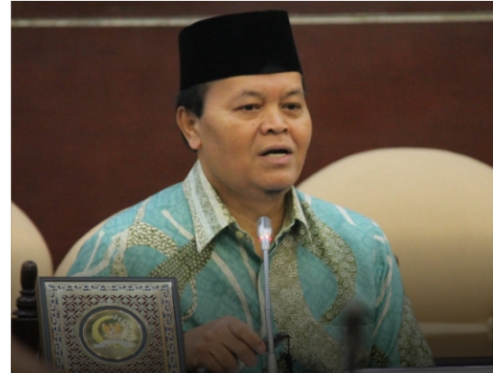
Dr. H.M. HIDAYAT NUR WAHID, M.A