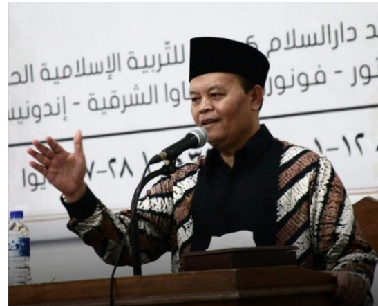
Dr. H.M. HIDAYAT NUR WAHID, M.A Anggota Komisi VIII DPR RI

"Habib Ali Kwitang juga sangat berjasa untuk dukungan atas kemerdekaan Indonesia dan penyebaran proklamasi kemerdekaan Indonesia di kalangan Umat Islam melalui jaringan para Habaib. Hingga kemerdekaan Indonesia cepat menyebar dan didukung oleh Umat hingga ke Majelis Taklim-Taklim. Karena Habib Ali Kwitang juga pendiri dan pimpinan pertama Majelis Taklim Kwitang