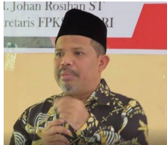
H. JOHAN ROSIHAN, S.T. Anggota Komisi III DPR RI

Saya minta pemerintah lebih cermat mengelola komoditas pangan strategis yang menyangkut hajat hidup rakyat banyak agar tidak mengalami lonjakan harga yang signifikan, manajemen harga dan stok pangan harus dikelola secara serius dan professional karena persoalan pangan sangat berpengaruh terhadap stabilitas nasional