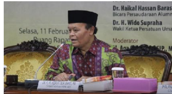
Dr. H.M. HIDAYAT NUR WAHID, M.A Wakil Ketua MPR RI

"Janganlah kedaulatan yg telah diberikan itu justru dimubazirkan dengan golput atau memilih secara asal-asalan. Nanti akan menyesal sendiri. Jangan mau kedaulatan yg berharga itu malah dihargai dengan money politik yang tidak seberapa, jangan mau ditipu dengan janji palsu, atau bantuan sembako yang mempengaruhi pilihan