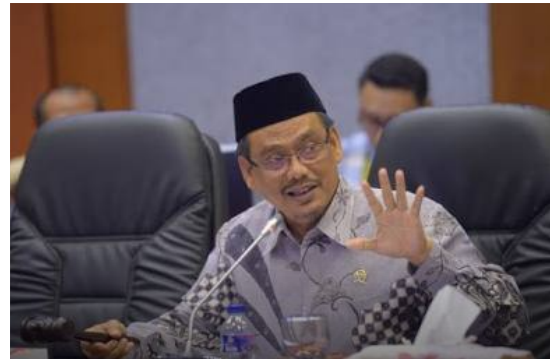
Dr. H. ABDUL FIKRI FAQIH, MM Wakil Ketua Komisi X DPR RI

Sebelumnya, Keputusan Bersama empat Menteri (Menteri Pendidikan dan Kebudayaan, Menteri Agama, Menteri Kesehatan, dan Menteri Dalam Negeri) Nomor 03/KB/2020, No. 612 tahun