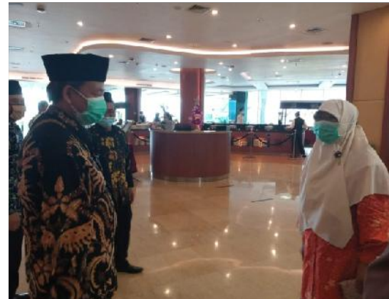
Hj. NUR AZIZAH TAMHID, B.A.,M.A. Anggota Komisi VIII DPR RI

Menanggapi kondisi tersebut Nur Azizah menjelaskan bahwa saat ini, negara memang belum hadir secara utuh dalam membimbing para remaja yang sudah masuk usia aqil baligh. “Jadi mudah-mudahan ada tindak lanjutnya, konten-konten media sosial yang dapat merusak moral, harus di tindak.