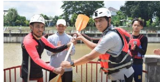
Dr. ABDUL KHARIS A, SE. M.Si.Akt Wakil Ketua Komisi 1 DPR RI

“Mudah-mudahan kedepan kalo ini sudah dibersihkan lalu juga dari sisi pengelolaan aspek safetynya itu sudah baik, kita berharap dari DPUPR bisa mendorong ini menjadi wisata sungai, karena ini potensi cukup lumayan, kita punya 10 kano saja sudah dilihat masyarakat, mereka sangat antusias, rupanya ini menjadi suatu yang menarik di Solo, karena selama ini belum ada.