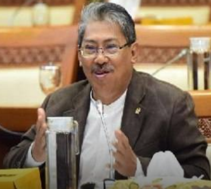
Dr. H. Mulyanto, M.Eng Anggota Komisi VII DPR RI

FRAKSI PARTAI KEADILAN SEJAHTERA DEWAN PERWAKILAN RAKYAT REPUBLIK INDONESIA